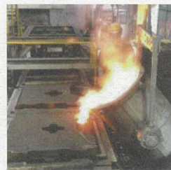
マンホール鉄蓋の製造工程

私たちの身のまわりにたくさんある「鉄」。今回の特別展では、科学的な面から鉄の不思議な性質に迫り、鉄とのつながりやモノづくりについて紹介します。工場見学などの関連イベントも予定しています!