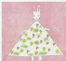
「わたしのワンピース」1969年 ©西巻茅子 / こぐま社

「わたしのワンピース」[ボタンのかに]など、世代を超えて愛され続けている数多くの作品を生み出してきた絵本作家・西巻茅子。本展では、多彩な手法で描かれた作品やラフスケッチを展示し、あたたかくのびやかな西巻茅子の絵本の世界へいざないます。」